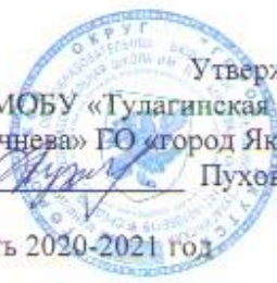
График питания в столовой на III четверть 2020-2021 год